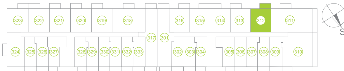
Půdorys podlaží / Floor plan